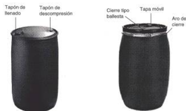
Fig. 1: Bidón de plástico Fig. 2: Bidón de plástico de tapa móvil