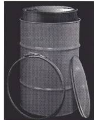
Fig. 5: Envase compuesto de acero y plástico de tapa móvil