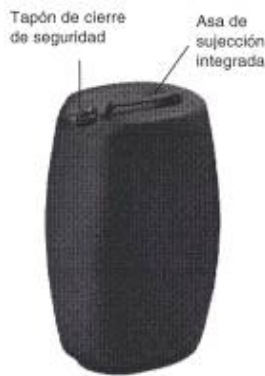
Fig. 3: Jerricán de plástico de tapa fija