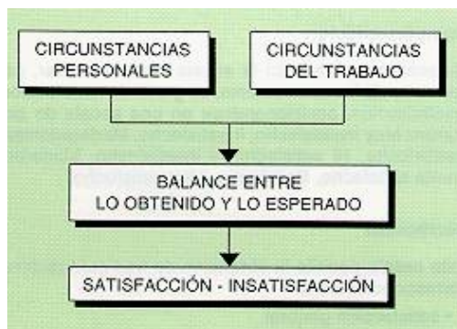
Fig. 1: Variables que inciden en la satisfacción laboral

Locke (1976) definió la satisfacción laboral como un "estado emocional positivo o placentero de la percepción subjetiva de las experiencias laborales del sujeto". En general, las distintas definiciones que diferentes autores han ido aportando desde presupuestos teóricos no siempre coincidentes reflejan la multiplicidad de variables que pueden incidir en la satisfacción laboral: como indica la Figura 1 de manera gráfica, las circunstancias y características del propio trabajo y las individuales de cada trabajador condicionarán la respuesta afectiva de éste hacia diferentes aspectos del trabajo.