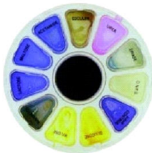
Figura 2. Métodos de diagnóstico dependientes del crecimiento bacteriano