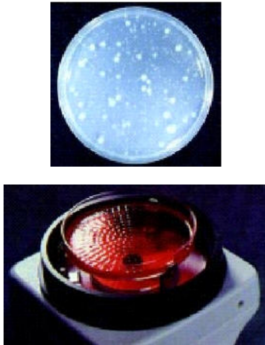
Figura 1. Recuento de colonias

La obtención de la concentración de microorganismos se basa en la relación entre el número de colonias que se han contabilizado y el volumen de aire aspirado, que es función del caudal al que esté calibrado el muestreador y el tiempo de muestreo. A menudo ocurre que el número de colonias contadas no responde a la realidad; las causas son diversas: en ocasiones, es difícil identificar como separadas, colonias formadas por agregados microbianos; o diferenciar colonias debido a que su morfología es muy similar; o por que una determinada especie segrega productos químicos que inhiben el crecimiento de otros microorganismos; o la morfología y/o tamaño de unas colonias obscurecen completamente otras. En la figura 1 se muestra una placa de cultivo en la que se aprecian las señales de la impactación de las partículas tras el proceso de muestreo y una placa en la que aparecen las colonias formadas.