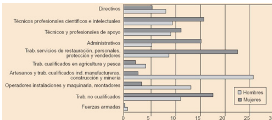
Figura 1 Población española ocupada en el II trimestre de 2003, por tipo de ocupación y sexo (datos en %)